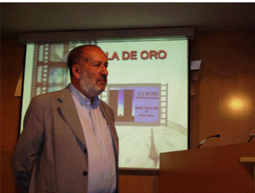
El director i productor de cinema, Josep Maria Forn, moments abans del lliurament del premi Rovira-Beleta, a l’Auditori FIATC de Barcelona