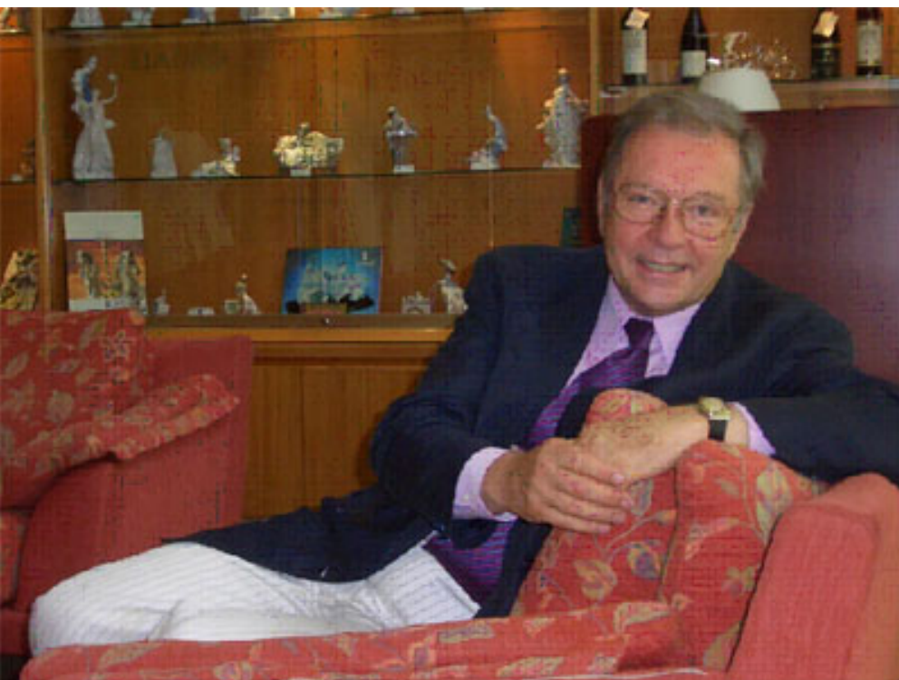
El cineasta polonès, Krzysztof Zanussi, creador del moviment “el cinema de la inquietud moral”