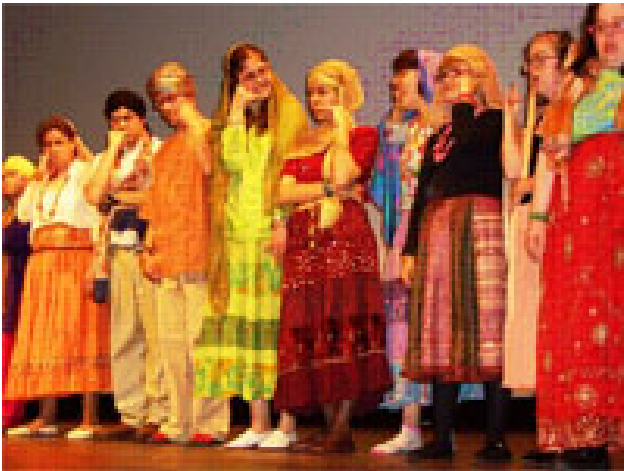
Infants amb diverses minusvàlues van protagonitzar un vistós espectacle de dansa i interpretació teatral