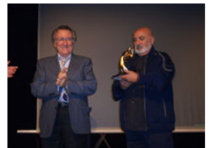
Peret va ser l'encarregat de lliurar-li de nou el premi a Badalona