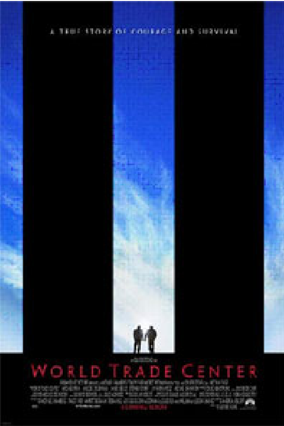
Cartell oficial de la pel·lícula “World Trade Center”, guanyadora de l’Ona d’Or a la millor pel·lícula amb valors humans, familiars i educatius

La pel·lícula guanyadora de l’Ona d’Or del XI Premi Cinematogràfic “Família” ha estat “World Trade Center”, de Oliver Stone . Correspon als films estrenats a Espanya l’any 2006.