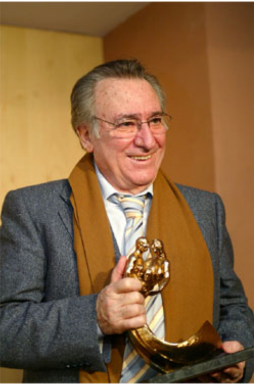
El cantant i actor Manolo Escobar va recollir, emocionat, l'Ona d'Or i va manifestar el seu amor per la família

Manolo Escobar sempre ha mostrat un gran amor a la seva família, fins i tot ha dit públicament que els dos grans amors de la seva vida són la seva dona i la seva filla.